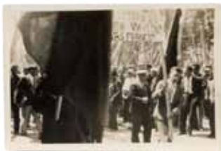
Manifestation à Gardanne contre Franco.

En 1940, Gilberto Bosques Saldivar, âgé de 48 ans, a déjà derrière lui une riche expérience d'homme politique et de journaliste. Nommé consul du Mexique en France, il transfère, après la défaite, ses services à Marseille et aide les républicains espagnols et autres « indésirables » à gagner le Mexique. Après l'Occupation de la zone libre, il est assigné à résidence en Allemagne, avec le personnel du consulat. Tous peuvent regagner leur pays à la faveur d'un échange avec des nazis arrêtés au Mexique.