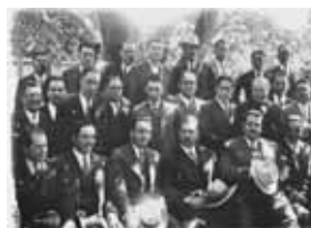
Les députés fédéraux avec le général Cardenas