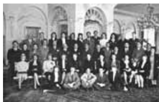
Le personnel du consulat à Bad Godesberg.