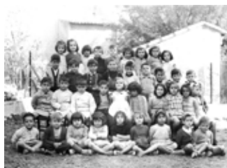
Les enfants à l'école communale.