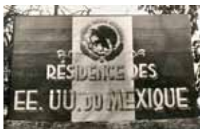
Le panneau à l'entrée de la Reynarde.