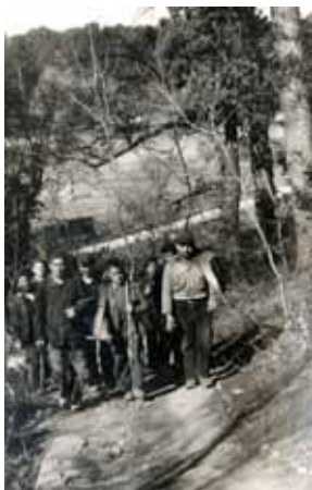
Tous travaillent. Ici, la coupe de bois.