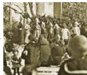
La fête enfantine