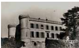
Vue d'ensemble du château de la Reynarde.

Dans l'attente des départs pour le Mexique, de 1940 à 1942, des centaines d'Espagnols sont hébergés dans deux grandes bastides (les « châteaux ») que Gilberto Bosques a louées dans la vallée de l'Huveaune, à Saint-Menet. Les hommes sont logés dans le château de la Reynarde, les femmes et les enfants dans celui de Montgrand.